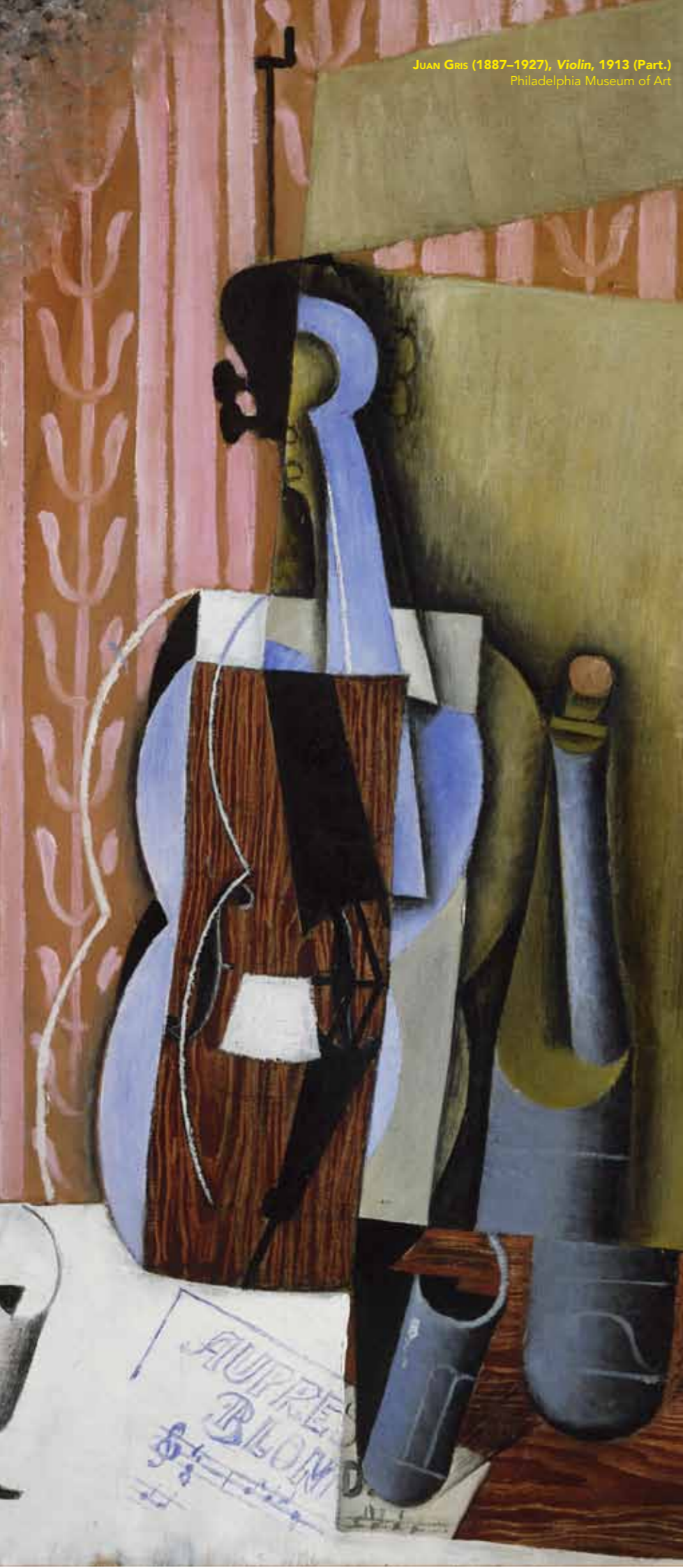
JUAN GRIS (1887-1927), Violin, 1913 (Part.) Philadelphia Museum of Art

CONSERVATORIO STATALE DI MUSICA LUIGI CANEPA