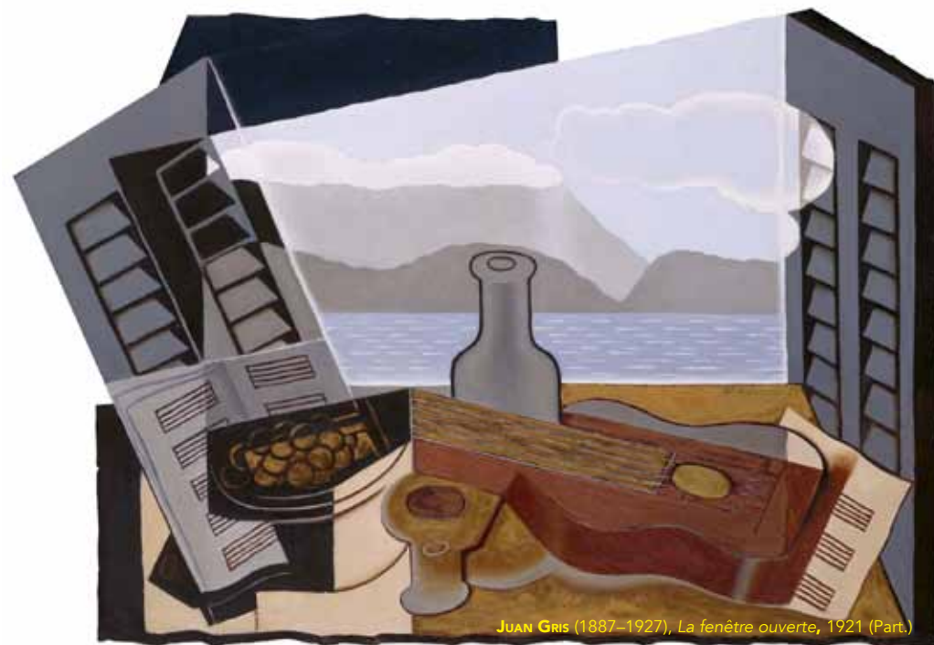
JUAN GRIS (1887–1927), La fenêtre ouverte , 1921 (Part.)